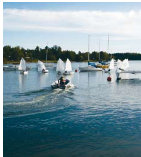
På väg till banan i lätt vind.