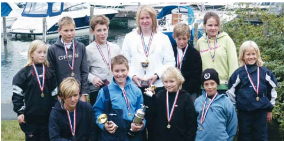
Vinnare av KM för Tvåkrona. (Något gladare och torrare än efter kapsejsningen.)