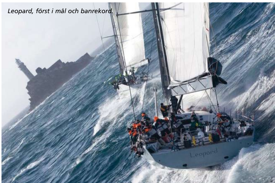
Leopard, först i mål och banrekord.