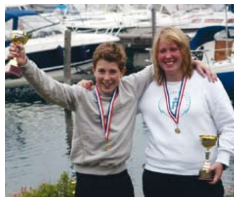
Glada deltagare efter KM 2007.