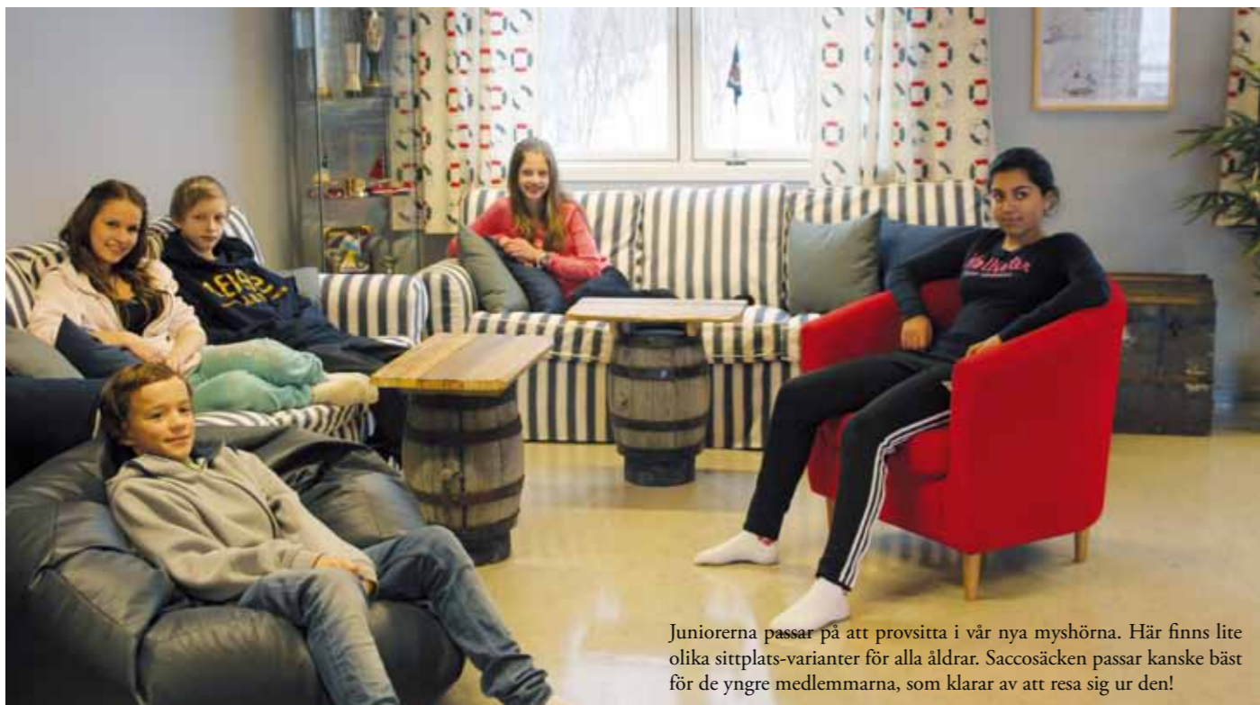
Juniörerna passar på att provsitta i vår nya myshörna. Här finns lite olika sittplats-varianter för alla åldrar. Saccosäcken passar kanske bäst för de yngre medlemmarna, som klarar av att resa sig ur den!