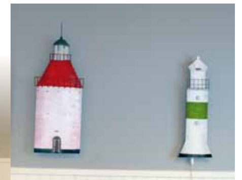
På styrbordsidan ser vi Landsorts och Pålköbbsgrunds fyrar. Den senare även försedd med blinkande ljus!