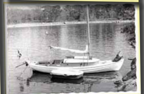
Furholmen 9 maj