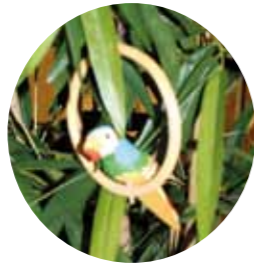
En riktig sjörövare har en papegoja. Denna söta lilla kompis vaktar skattkistan!