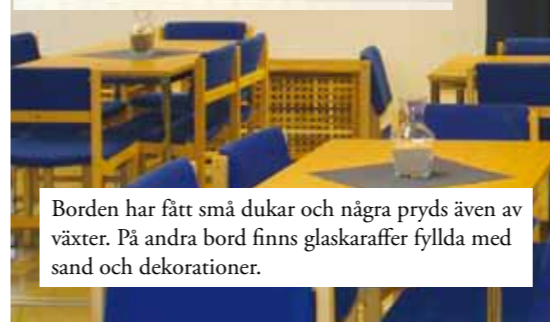
Borden har fått små dukar och några pryds även av växter. På andra bord finns glaskaraffer fyllda med sand och dekorationer.