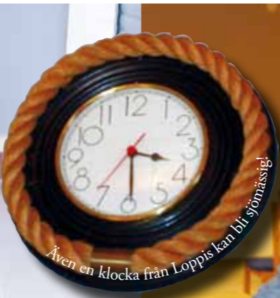
Även en klocka från Loppis kan bli sönemässig!