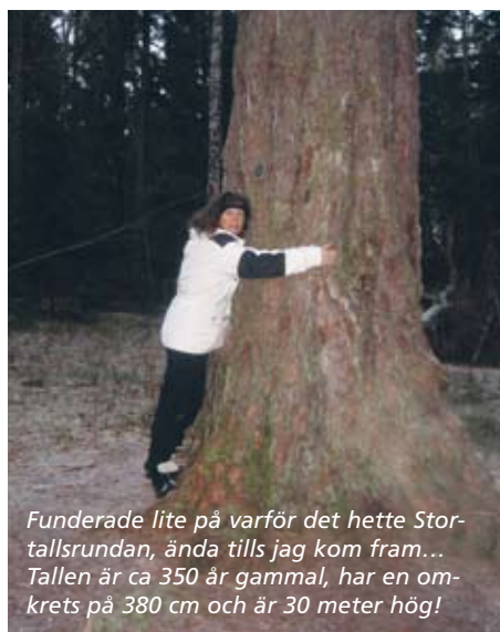
Funderade lite på varför det hette Stortallsrundan, ända tills jag kom fram... Tallen är ca 350 år gammal, har en omkrets på 380 cm och är 30 meter hög!

Vill man nöja sig med en kortare tur finns Råholmastigen, 2 km lång, längs Kyrkfjärdens innersta del. Även här hittar man en mycket trevlig rastplats med vindskydd och grill. Att utforska Bogesundslandet tar nog hela vintern!