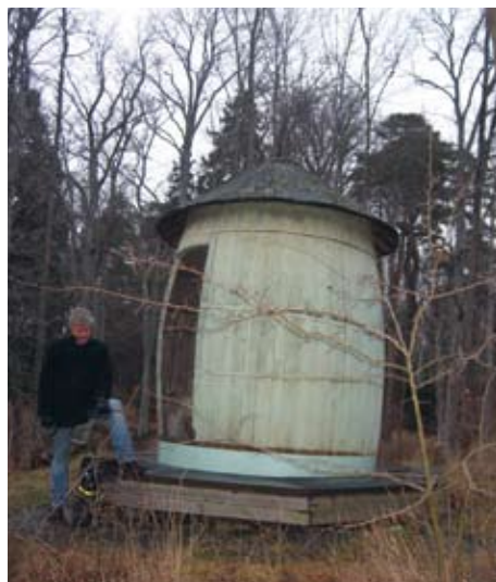
Diogenes tunna, tänk vad roligt det måste ha varit på den tiden den var fylld av vin!