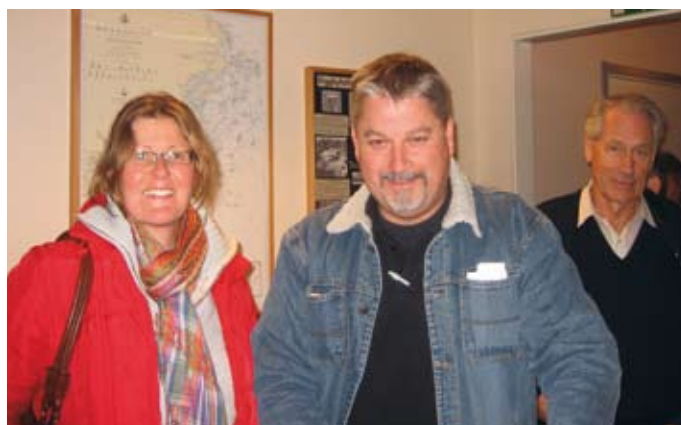
Visst är det kul att komma på Höstmöte, lite omväxling till alla slit-samma stunder nere i hamnen.