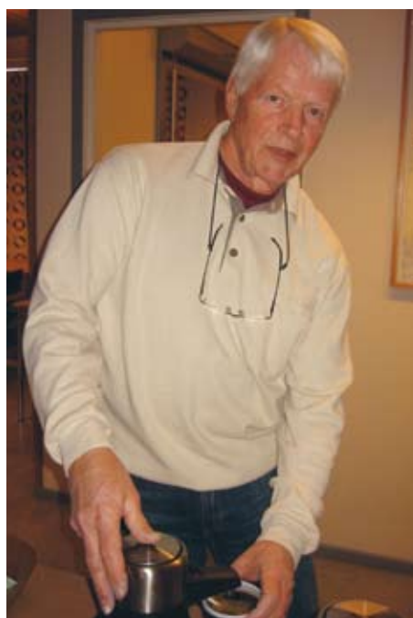
Visst smakar det bra med en kopp nybryggt, när man kommer in från kylan?