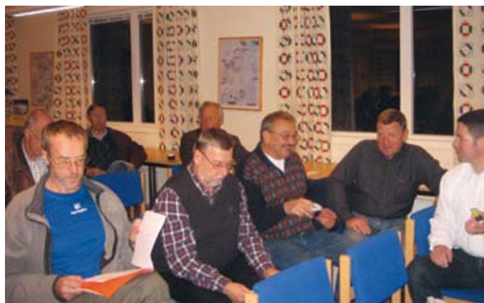
Delar av styrelsen passar på att avhandla mindre allvarliga ting innan mötet.

Junioravgifterna hittar du på hemsidan www.vbk.a.se eller i Vimpeln nummer 1/2009.