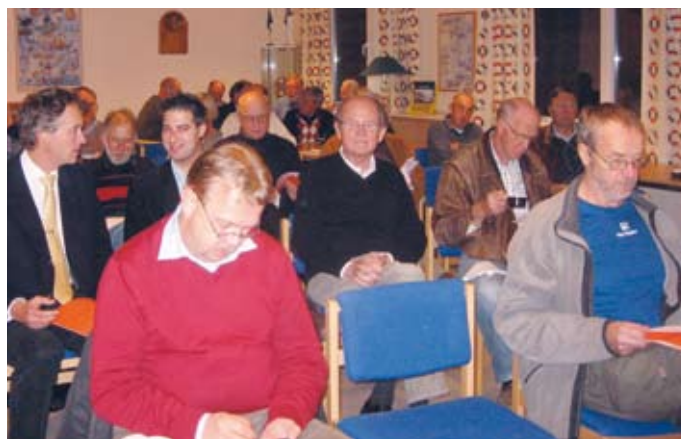
Var är alla tjejerna?