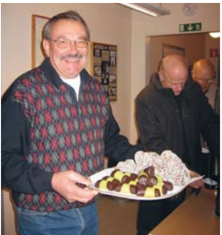
Men Anders, det ska räcka till alla!