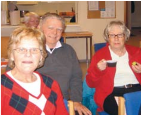
Några medlemmar ur gamla Furholmsgruppen. Kanske nyfikna på vad det nya Furis-gänget har för planer inför 2009?

Runt 60 positiva medlemmar strömmade till vid årets Höstmöte den 4 november i Klubbhuset. Både kända och okända ansikten samlades för att lyssna på informationen om klubbens verksamhet och fatta beslut om budget och avgifter för år 2009.