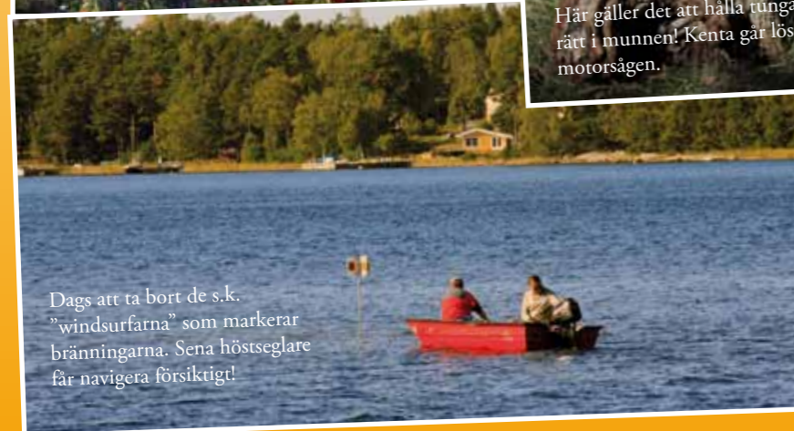
Dags att ta bort de s.k. "windsurfarna" som markerar bränningarna. Sena höstseglare får navigera försiktigt!