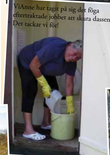
ViAnne har tagit på sig det föga eftertraktade jobbet att skura dassen. Det tackar vi för!