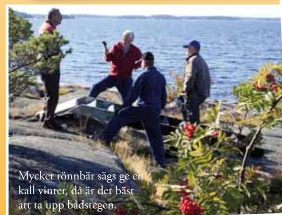
Mycket rönnbär sägs ge en kall vinter, då är det bäst att ta upp badstegen.