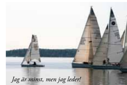
Jag är minst, men jag leder!

Som vanligt när vi arrangerar Alandia Värtan Cup var vindarna ytterst måttliga på den planerade starttiden klockan 10 så det blev att skicka upp flagga AP som betyder uppskjuten start, något som få kappsegelare uppskattar. Det betyder att man måste ligga kvar i startområdet och vänta, för så länge AP-flaggan är hissad kan ar-