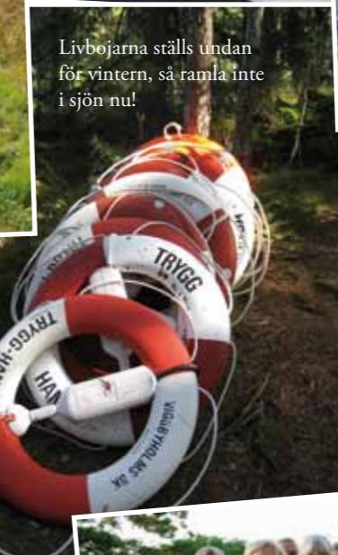
Livbojarna ställs undan för vintern, så ramla inte i sjön nu!