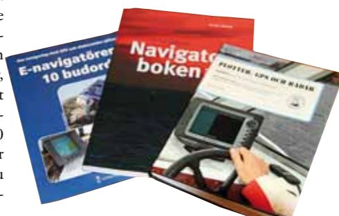
Two bra böcker att lägga i julklappsäcken Broschyren kan ni hitta på Sjöfartsverkets hemsida

brukar sucka ljudligt när maken visar någon ny "häftig" funktion under vild sjögång på havet. I det läget är 3D-vision ointressant för min del, hur coolt det än ser ut.