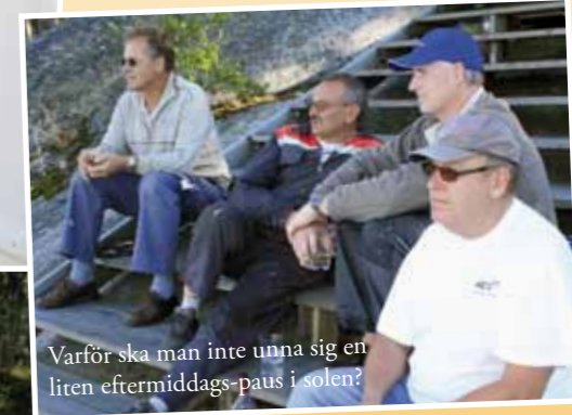
Varför ska man inte unna sig en liten eftermiddags-paus i solen?