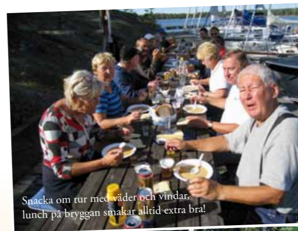
Snacka om tur med väder och vindar, lunch på bryggan smakar alltid extra bra!