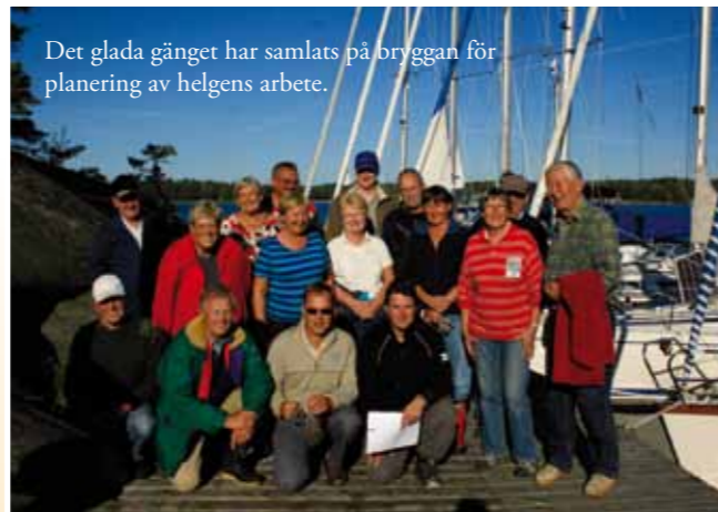
Det glada gänget har samlats på bryggan för planering av helgens arbete.