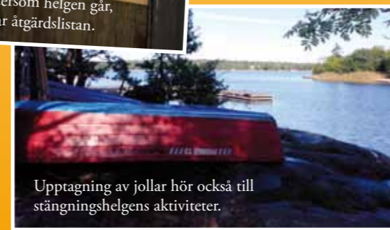
Upptagning av jollar hör också till stängningshelgens aktiviteter.