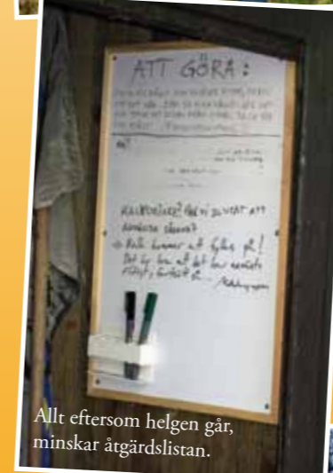
Allt eftersom helgen går, minskar åtgärdslistan.