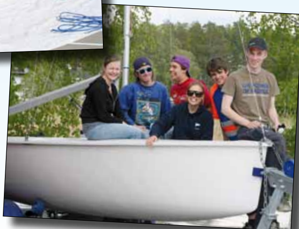
Några av sommarens juniorledare i en av våra nyinköpta C55:or