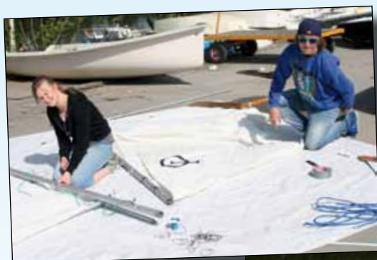
Här får Optimisternas segel nya litsar

Nu är det snart dags för årets seglarskola att dra igång. Anmälningarna till seglarskolan har strömmat in och alla grupper är fulltecknade. Vid juniorbodarna hörs musik strömma ut ur en högtalare medan de glada ledarna fixar i ordning jollarna inför säsongen. Alla jollar ses över och putsas upp och seglen repareras. Ungefär 40 båtar handlar det om att vårusta!