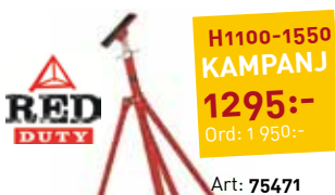
BÅTSTÖTTA RED DUTY SEGELBÅT

TEMAKVÄLL! "BÅTTÄCKNING" PRESS & SON MÅNDAG 1 OKT KL.18-20 VI HAR BOCKAR OCH SKRÄDDARSYDDA TÄCKSTÄLLNINGAR FRÅN PRESS & SON