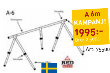
A-TÄCKSTÄLLNING Red Duty