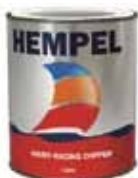
HEMPEL HARD RACING COPPER 0,75L HÅRD BOTTENFÄRG