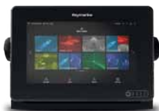
RAYMARINE AXIOM 7DV INKL GIVARE OCH SJÖKORT 7" PLOTTER