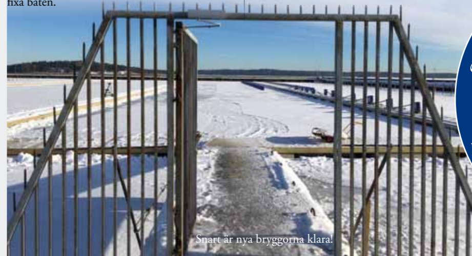
Snart är nya bryggorna klara!

• Se över båtens förtöjningar innan sjösättning, ska du ligga vid y-bommar istället för pålar så kanske du vill komplettera/byta ut några linor, fjädrar eller schackel.