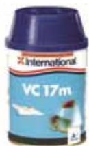
INTERNATIONAL VC17 0,75L HÅRD BOTTENFÄRG