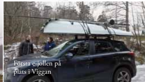
Första e-jollen på plats i Viggan