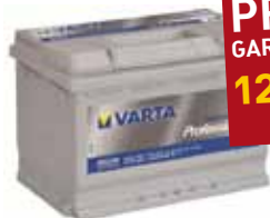
BATTERI VARTA PROFESSIONAL 75AH, 650A(EN)