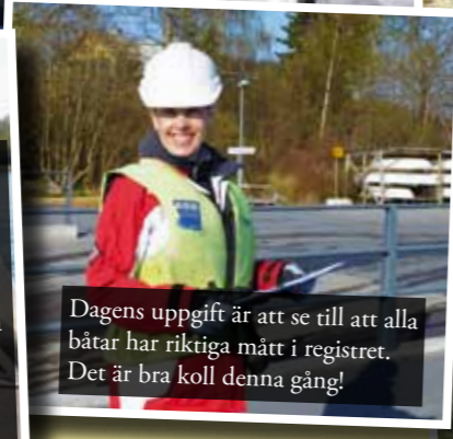
Dagens uppgift är att se till att alla båtar har riktiga mått i registret. Det är bra koll denna gång!