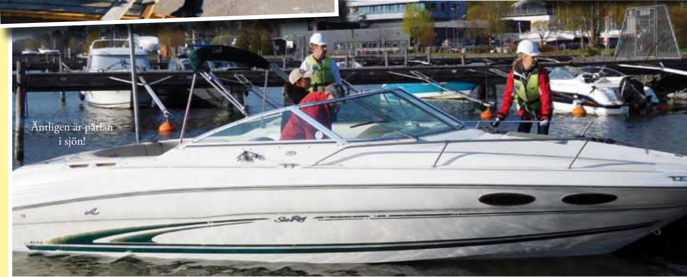
Äntligen är pärlan i sjön!