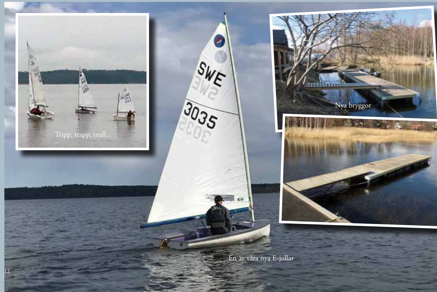
Tripp, trapp, trull...