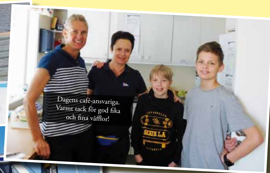
Dagens café-ansvariga. Varmt tack för god fika och fina våfflor!