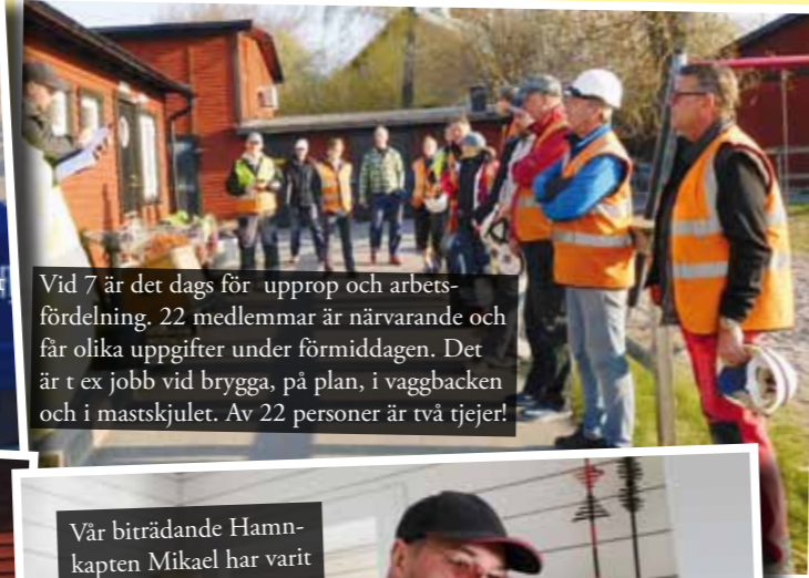
Vid 7 är det dags för uppprop och arbetsfördelning, 22 medlemmar är närvarande och får olika uppgifter under förmiddagen. Det är t ex jobb vid brygga, på plan, i vaggbacken och i mastskjulet. Av 22 personer är två tjejer!