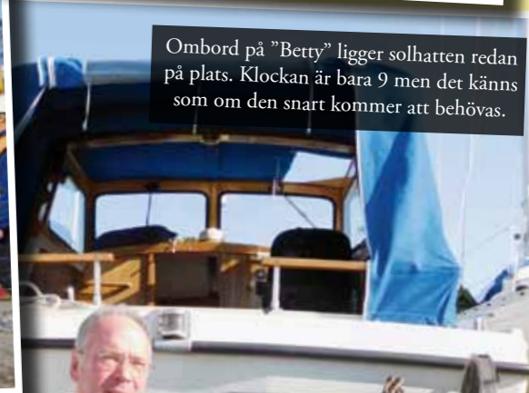
Ombord på "Betty" ligger solhatten redan på plats. Klockan är bara 9 men det känns som om den snart kommer att behövas.