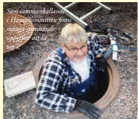
Som sammankallande i Hamnkommittén finns många spännande uppgifter att ta tag i!