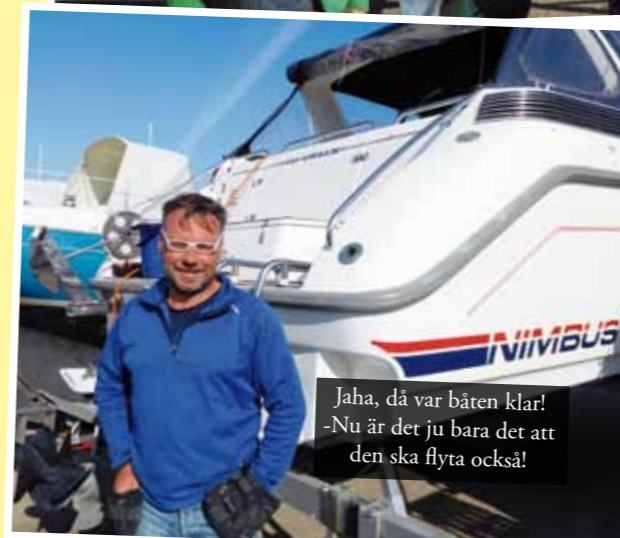
Jaha, då var båten klar! -Nu är det ju bara det att den ska flyta också!