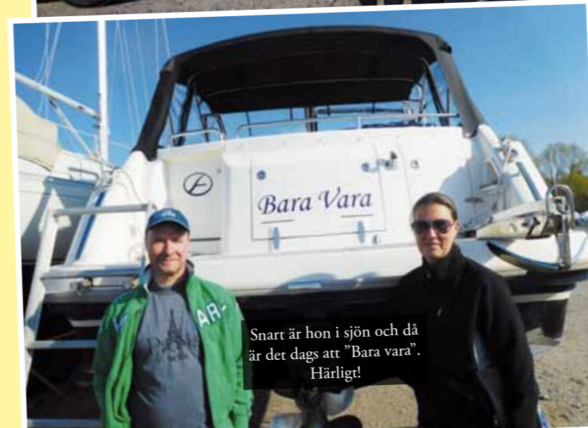
Snart är hon i sjön och då är det dags att "Bara vara". Härligt!