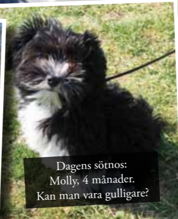
Dagens sötnos: Molly, 4 månader. Kan man vara gulligare?