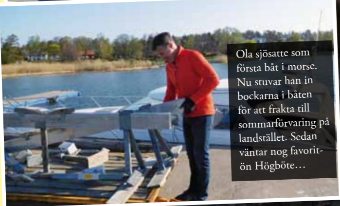
Ola sjösatte som första båt i morse. Nu stuvor han in bockarna i båten för att frakta till sommarförvaring på landstället. Sedan väntar nog favoritön Högböte...