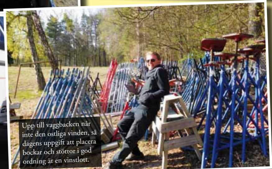
Upp till vaggbacken när inte den ostliga vinden, så dagens uppgift att placera bockar och stöttor i god ordning är en vinstlott.