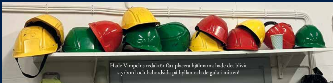
Hade Vimpelns redaktör fått placera hjälmarna hade det blivit styrbord och babordsida på hyllan och de gula i mitten!