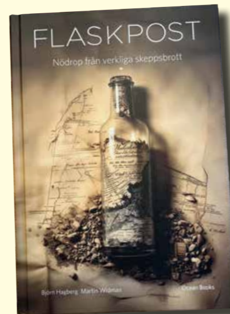
Boken Flaskpost kostar 259 SEK hos Adlibris

Många är vi som någon gång på skoj har kastat i en flaskpost med en hälsning till en okänd upphittare. I boken Flaskpost är det däremot äkta nödrop och hälsningar som presenteras. Detta tillsammans med snyggt tecknade kartor som visar skeppens väg, eller troliga väg, innan de gick under, ofta med man och allt.