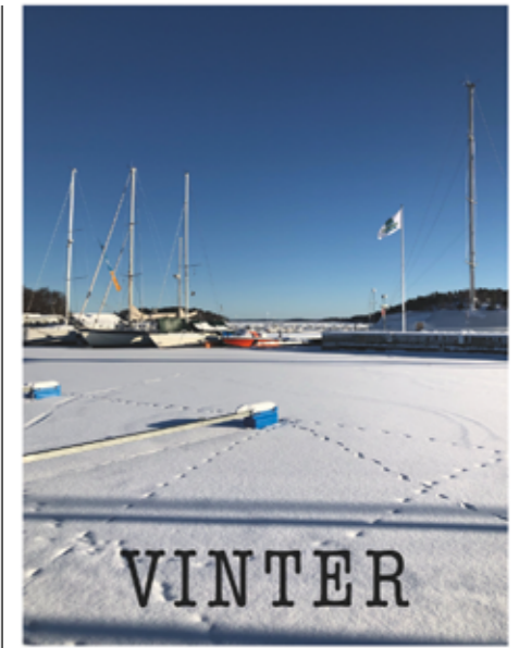
Isen ligger tjock över sjön. Med snön som ett täcke.