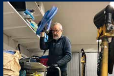
När inte ens Lasse Be når, så är det högt i tak