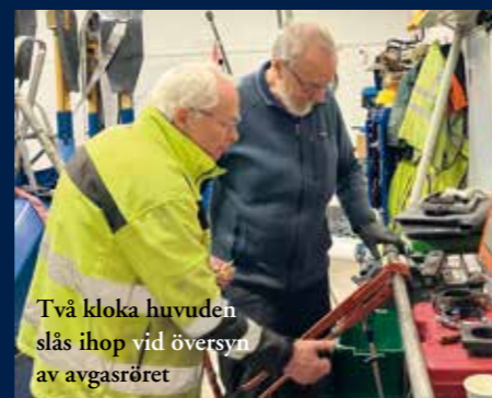
Två kloka huvuden slås ihop vid översyn av avgasröret