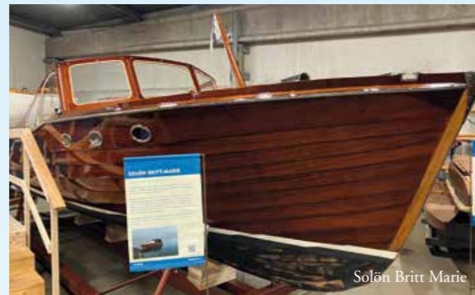
Solön Britt Marie

IF nr 1, Goal, är så blank att man kan spegla sig i skrovsidan och Solön Britt Marie är en dröm för träbåtsentusiasterna. Vid en Segebaden-jolle berättas att den sägs kunna ta 4 personer, men då är det bara 2 cm av fri-borden kvar ovanför vattenytan, en stråhatt och en ölbutelj på toften ger oss en känsla av hur skönt det var att glida ut i den lilla jollen en solig som-mardag. Här finns också en Electrolux Campingbåt och Starbåten Balett, Mary Ann, en Chris Craft från 1938 och Albin 25 Elin med 70-tals stuk på solstolarna framför stäven. I båten intill står den sötaste och minsta ångmaskin man kan tänka sig och vi får veta att den kallades kolibri-maskin och att båten därför fick heta Kolibribåt. Den supergulliga lilla racern Dixie, som sin storlek till trots sägs vara förvånansvärt sjöduglig, blev snabbt min egen favorit!