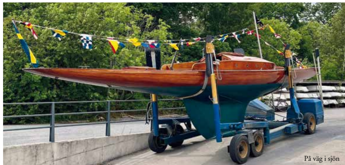
På väg i sjön