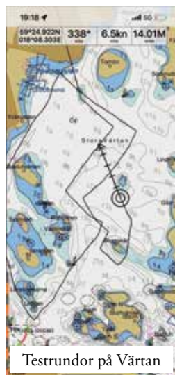
Testrundor på Värtan

Skepparen hälsar att han lever och är nöjd! Grattis säger vi i VBK till ett fantastiskt jobb och skicklig segling!