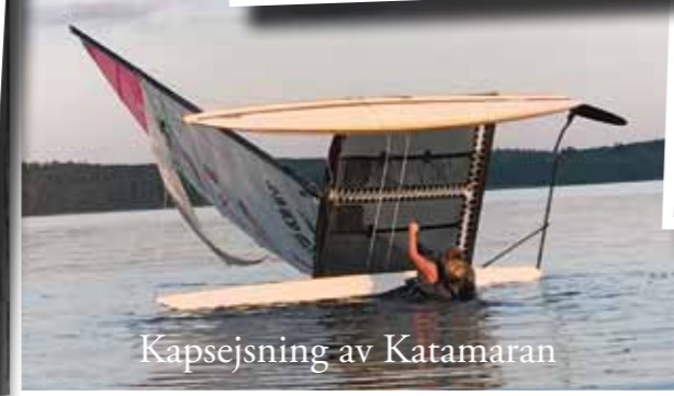
Kapsejsning av Katamaran