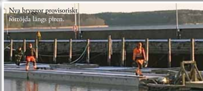
Nya bryggor provisoriskt förröjda längs piren.