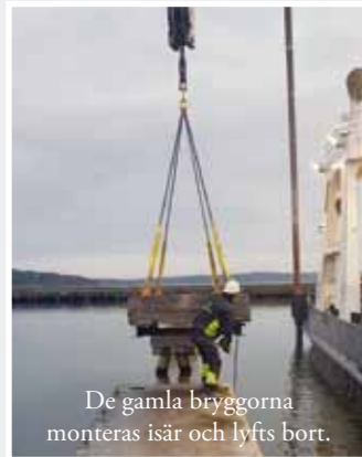
De gamla bryggorna monteras isär och lyfts bort.

Sedan den 1 november har det hänt mycket nere i hamnen. Det började med att våra gamla stolpar vid E- och F-bryggorna lyftes upp och fraktades bort, sedan försvann de gamla bryggorna och till sist även fundamenten. Under några dagar blev det nästan spöklikt tomt innanför piren, för vad är väl en hamn utan bryggor? Nu börjar det likna en hamn igen och de nya bryggorna kommer på plats sakt men säkert. Vimpeln har försökt att följa arbetet och här kommer lite fotodokumentation: