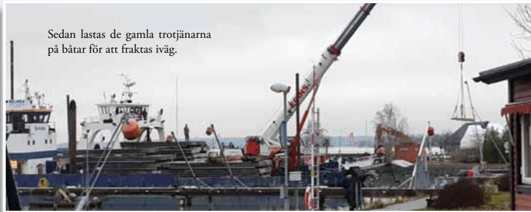
Sedan lastas de gamla trojänarna på båtar för att fraktas iväg.