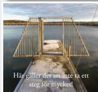
Här gäller det att inte ta ett steg för mycket!