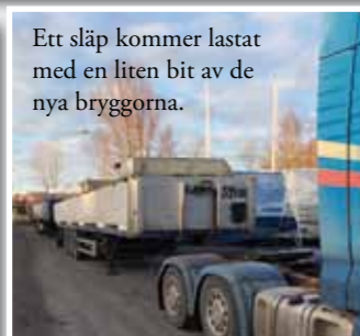
Ett släp kommer lastat med en liten bit av de nya bryggorna.