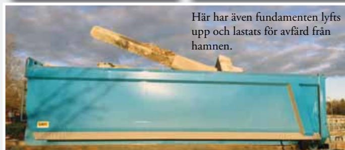
Här har även fundamenten lyfts upp och lastats för avfärd från hamnen.