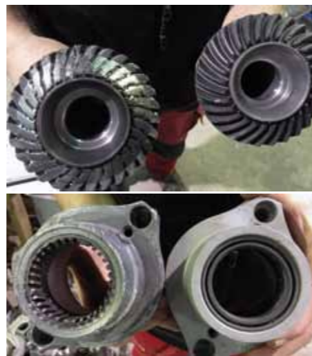
Exempel på hur slitna delar kan se ut i jämförelse med nya.