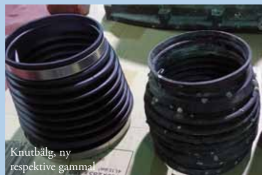
Knutbälge, ny respektive gammal