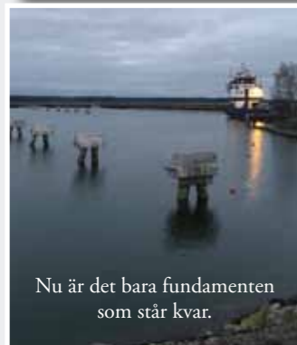
Nu är det bara fundamenten som står kvar.