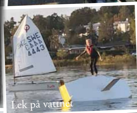
Lek på vattnet