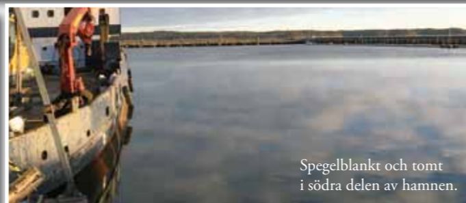
Spegelblankt och tomt i södra delen av hamnen.