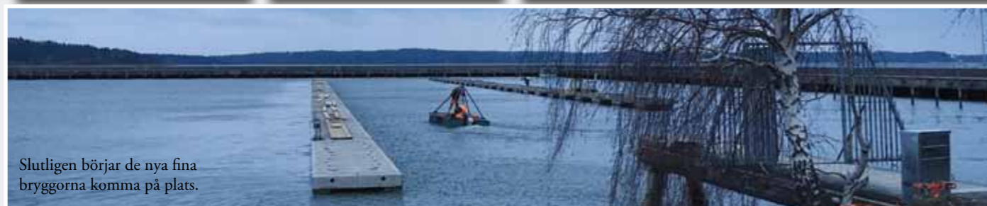
Slutligen börjar de nya fina bryggorna komma på plats.