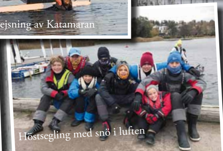
Höstsegling med snö i luften