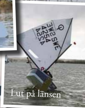
Lut på länsen