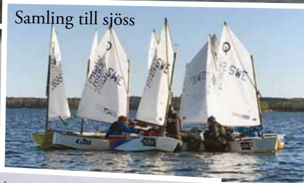
Samling till sjöss