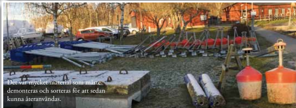
Det var mycket material som måste demonteras och sorterats för att sedan kunna återanvändas.